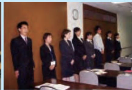
【写真】ビジネスマナー日本語授業風景